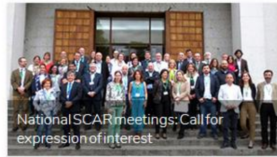
National SCAR meetings: Call for expression of interest

National SCAR meetings are a means to increase visibility of SCAR, to promote SCAR outcomes and to provide a forum for exchange between stakeholders at the national and EU level on bioeconomy issues. The SCAR CASA project (Task 1.4) can support delegates who are interested in having a national SCAR meeting in their country.