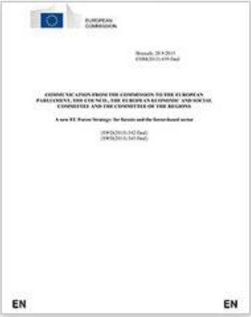
A new EU Forest Strategy: for forests and the forest-based sector