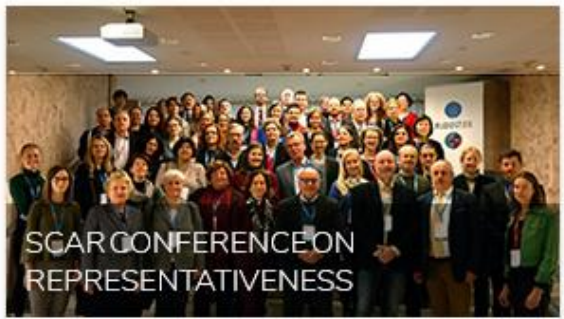
SCAR CONFERENCE ON REPRESENTATIVENESS

SCAR Conference videos: - 4 December 2017 - 5 December 2017