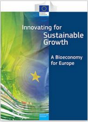
Innovating for Sustainable Growth - A Bioeconomy for Europe